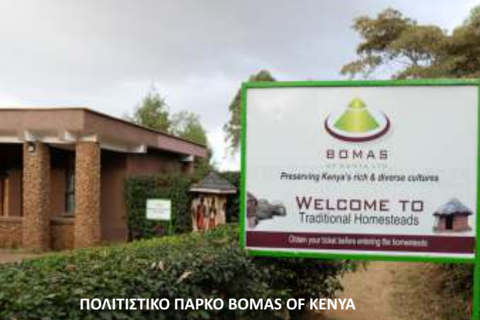
ΠΟΛΙΤΙΣΤΙΚΟ ΠΑΡΚΟ BOMAS OF KENYA